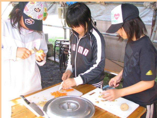
野外炊飯（カレー作り）