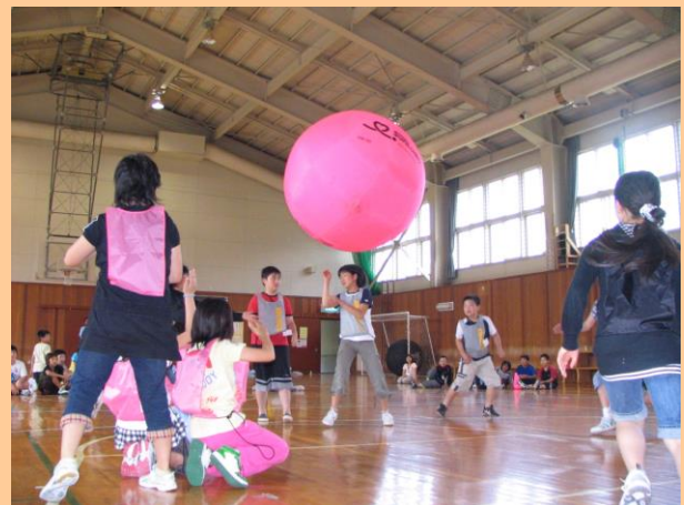
ニュースポーツ体験