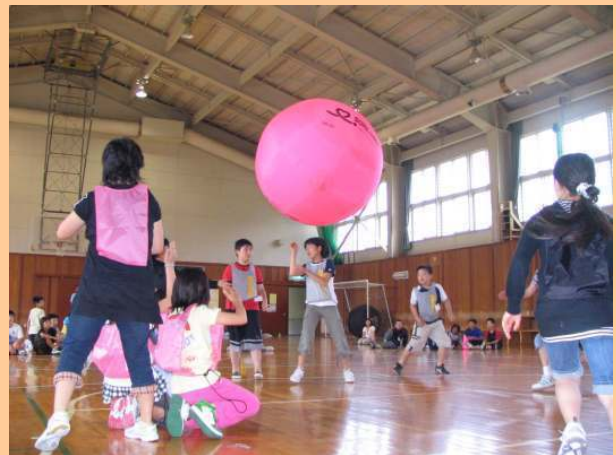
ニュースポーツ体験