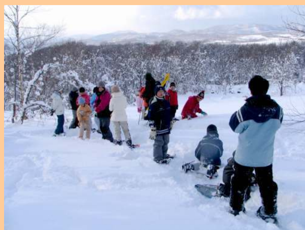
スノーシュートレッキング