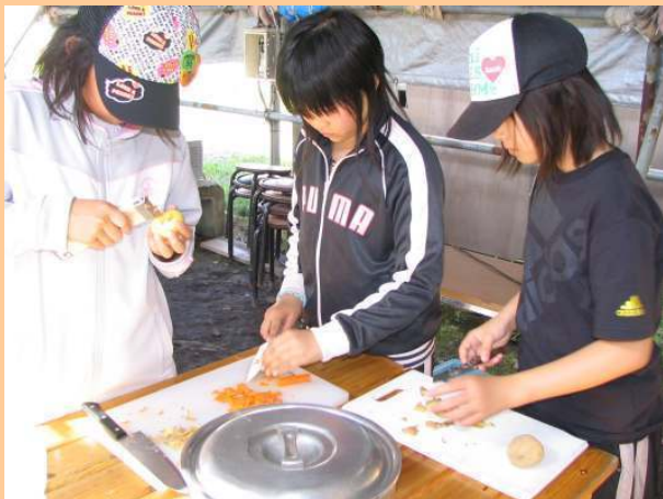
野外炊飯（カレー作り）