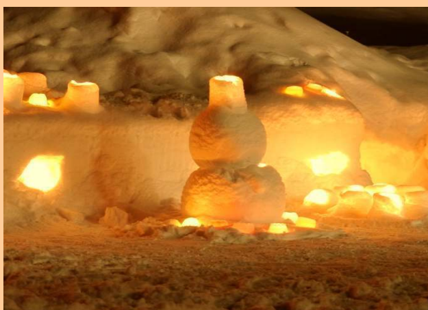
スノーキャンドル